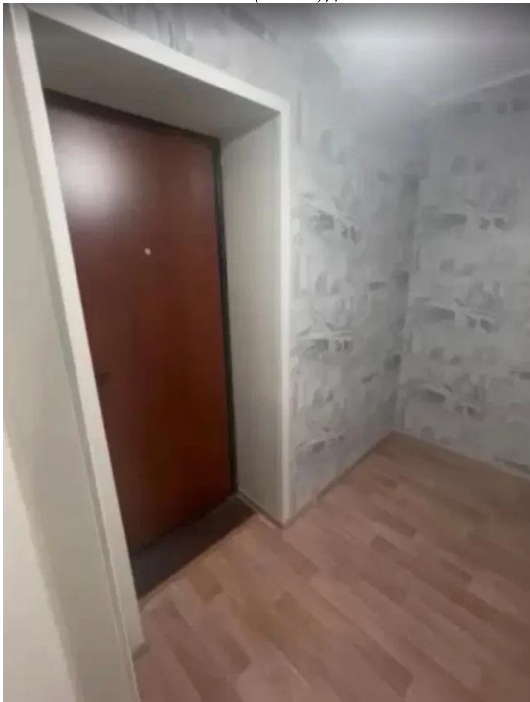
ФОТО КВАРТИРЫ (ЛОТ №1) ДОЛЖНИКА: