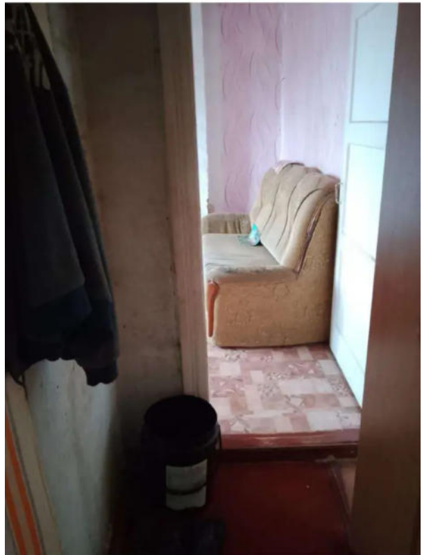
Фото №8. Общий вид