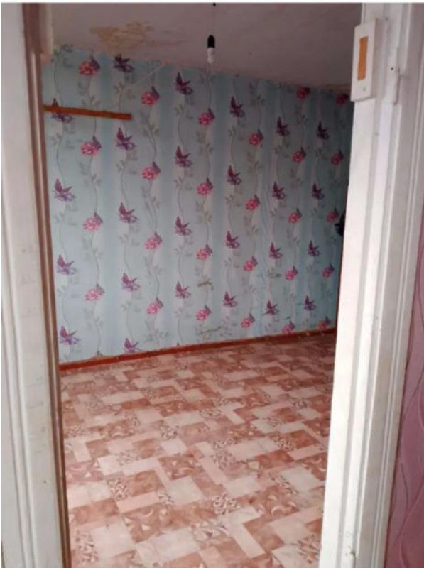
Фото №11. Общий вид