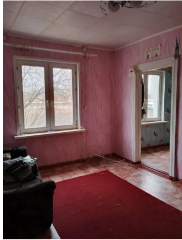
Фото №10. Общий вид