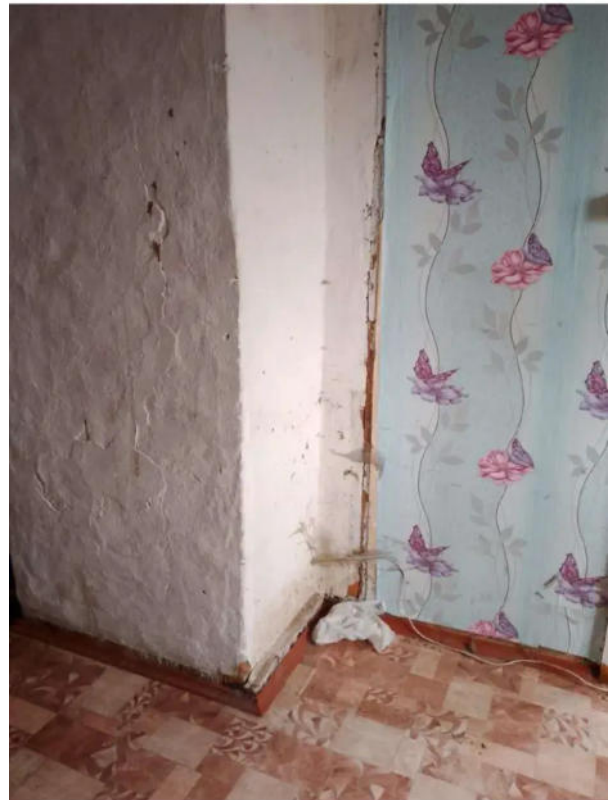
Фото №12. Общий вид