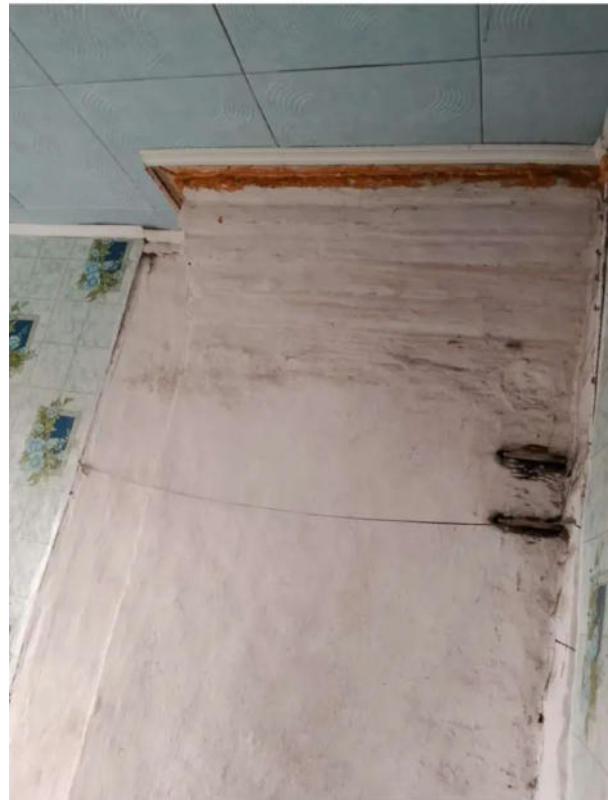
Фото №16. Общий вид