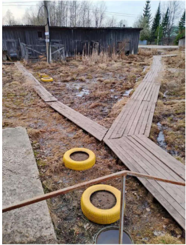
Фото №18. Общий вид