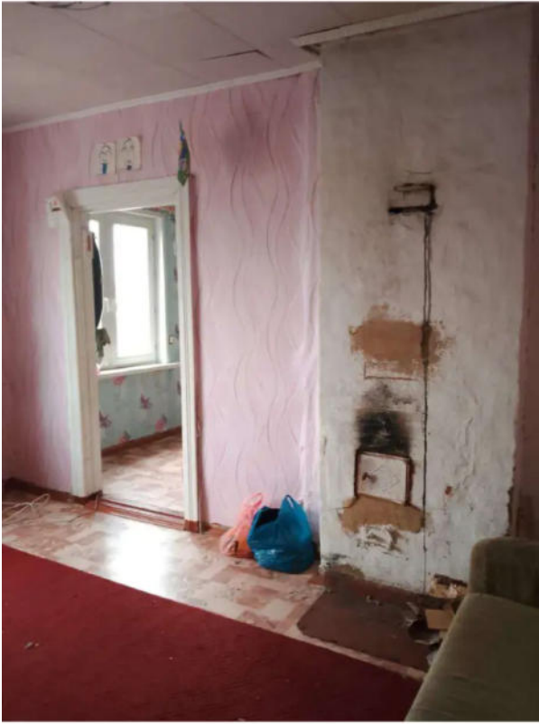
Фото №9. Общий вид