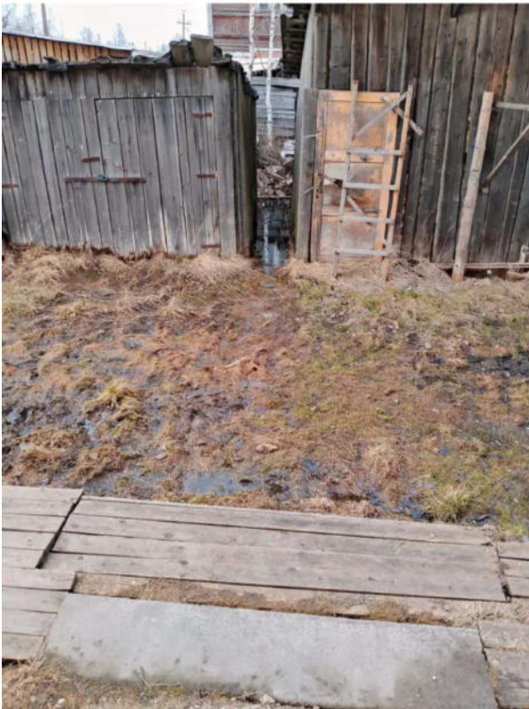
Фото №19. Общий вид