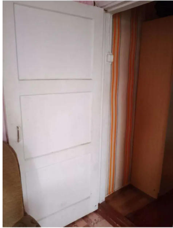
Фото №14. Общий вид