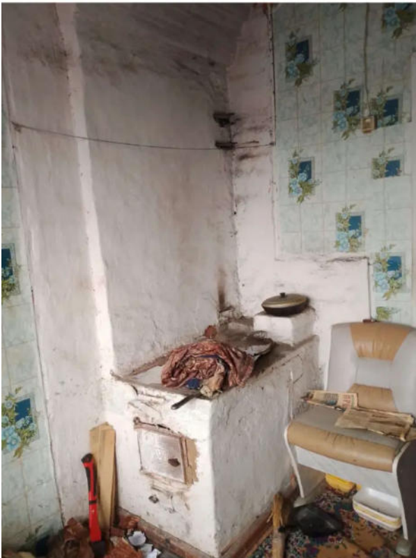
Фото №7. Общий вид