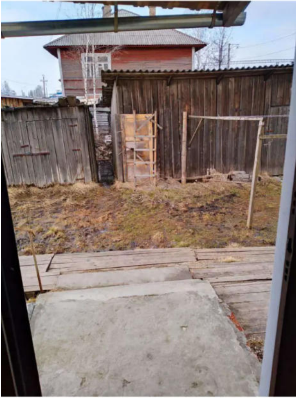
Фото №17. Общий вид