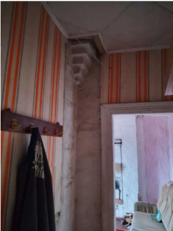
Фото №15. Общий вид