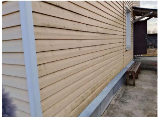
Фото №20. Общий вид