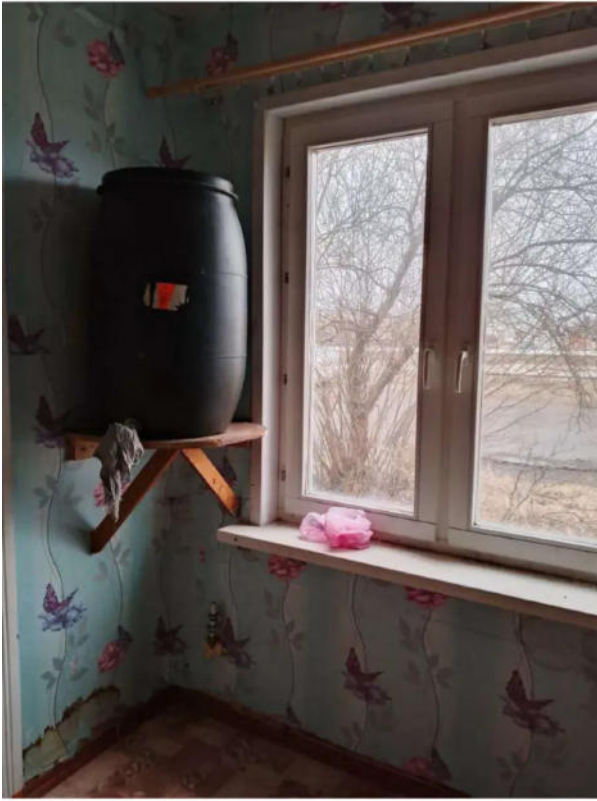
Фото №13. Общий вид