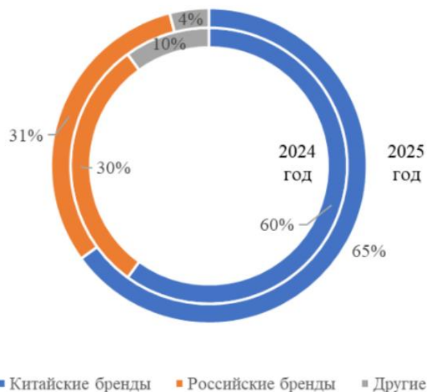
Структура рынка по брендам (2024 vs 2025)

В 2025 году российский автомобильный рынок продолжал формироваться вокруг двух центральных групп игроков: локализованных отечественных брендов и китайских производителей, занявших доминирующее положение после ухода западных компаний. Конкуренция между ними усиливается, а стратегии развития всё больше зависят от степени локализации, государственной поддержки и способности адаптироваться к экономическим и технологическим вызовам.