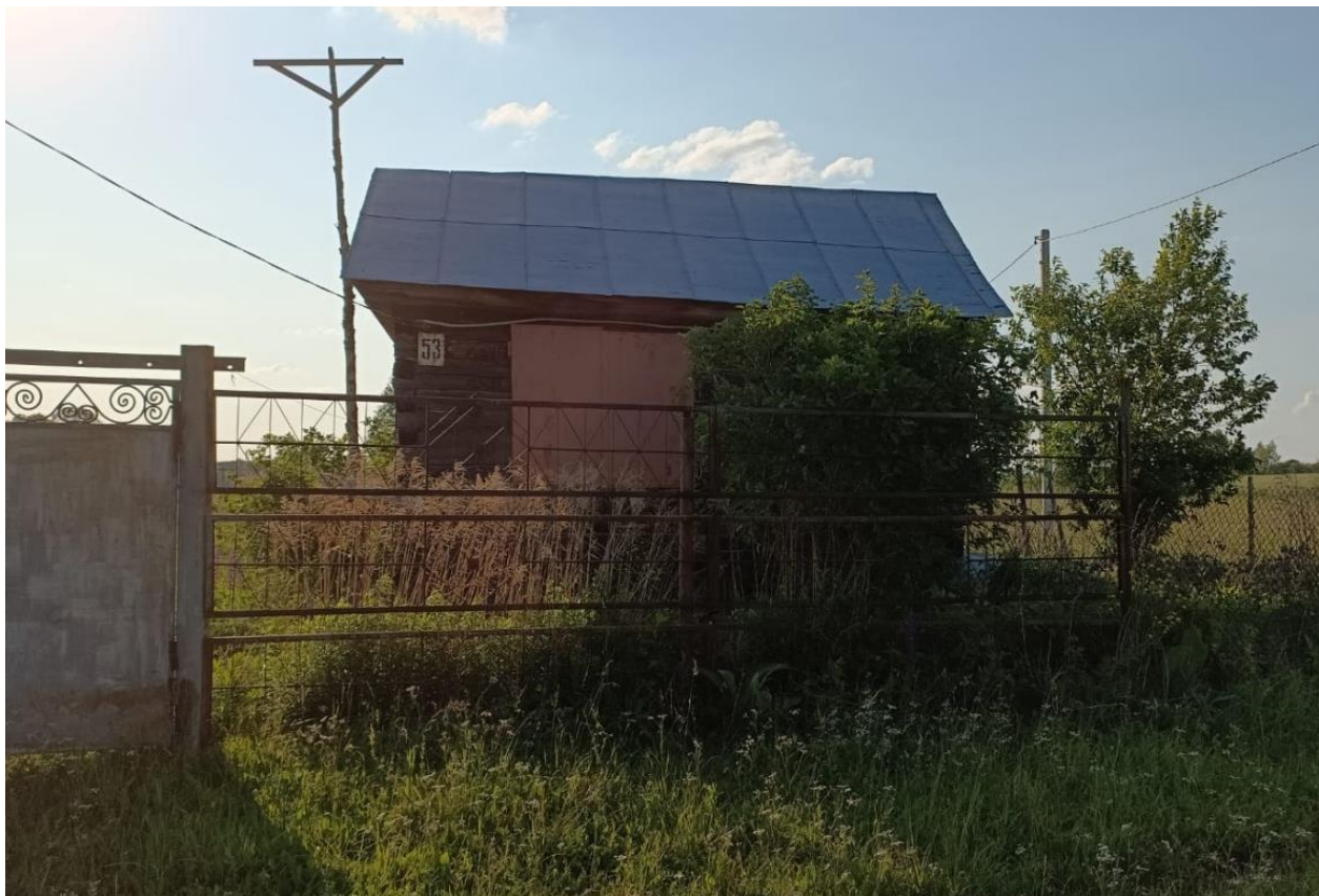
Соседний дом 536