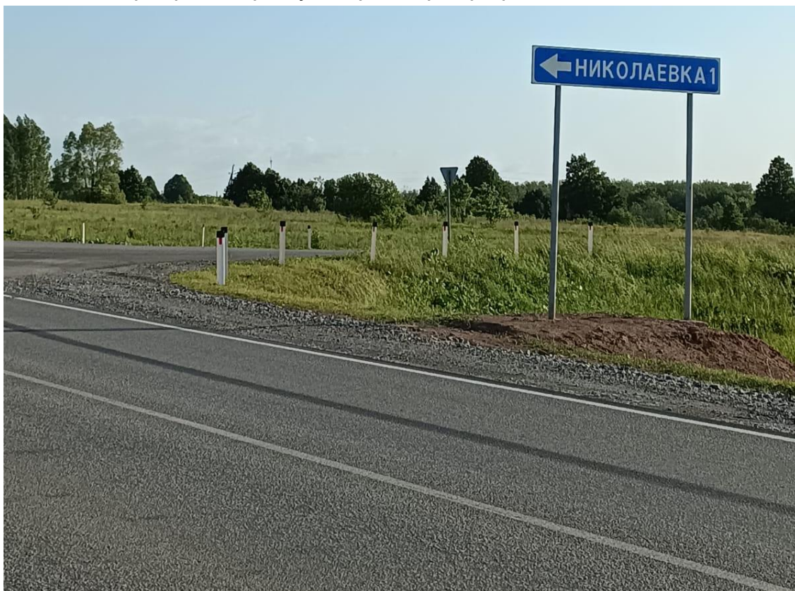
Начало ул. Мира

Осмотр производился 08.06.2023. Съёмка производилась в светлое время суток на фотокамеру с GPS модулем. Сопоставление EXIF данных фотофайла с картой гугл и картой Росреестра произведено.