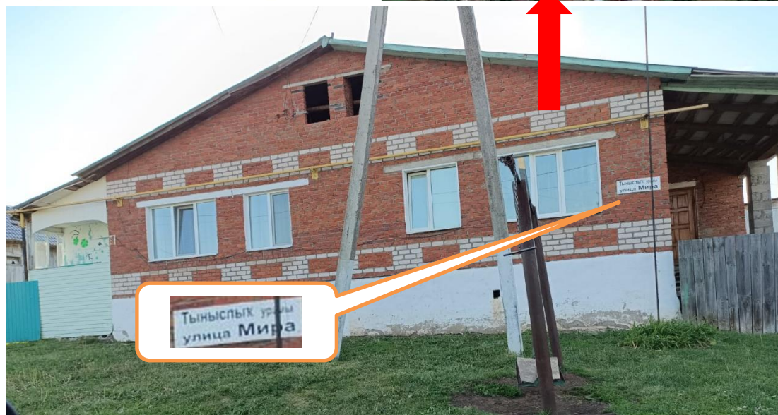
три участка с номером 53. Слева 53, справа новый дом 536, в середине участок - объект оценки 53а